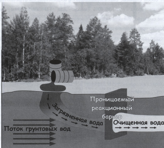
Рис. 2. Установка ПРБ с помощью кремний-гуминовых производных, самопроизвольно сорбирующихся на минеральных породах водоносного горизонта.

Для природоохранных технологий нашей группой были разработаны сорбенты, уникальной особенностью которых является способность образовывать прочные ковалентные связи с минеральными поверхностями. Способ синтеза разработанных производных списан в международной патентной заявке (WO/2007/102750 Humic derivatives methods of preparation and use, PCT/RU2006/000102). Это позволяет рекомендовать кремний-гуминовые производные для технологий очистки водоносных горизонтов, требующих установки проницаемых реакционных барьеров (ПРБ). Принцип действия гуминового ПРБ показан на Рис.2.